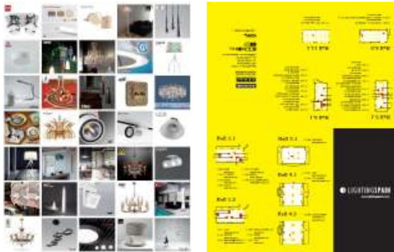
Imagen del stand en la feria Light & Builing